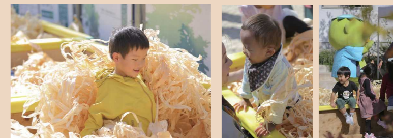
いい匂いのする木のカンナプールもあるよ。みんなで遊びに来てね!!