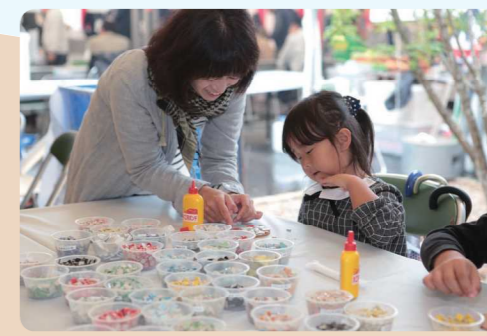
美濃焼きタイルを使った小物作り体験 D-1~4