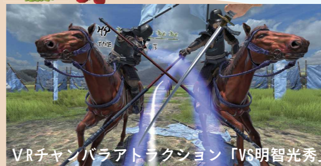
VRチャンバラアトラクション「VS明智光秀」 C-4

※会場に駐車場はございません。ご来場の際には臨時駐車場が公共交通機関をご利用の上、シャトルバスをご利用ください。(裏面参照)