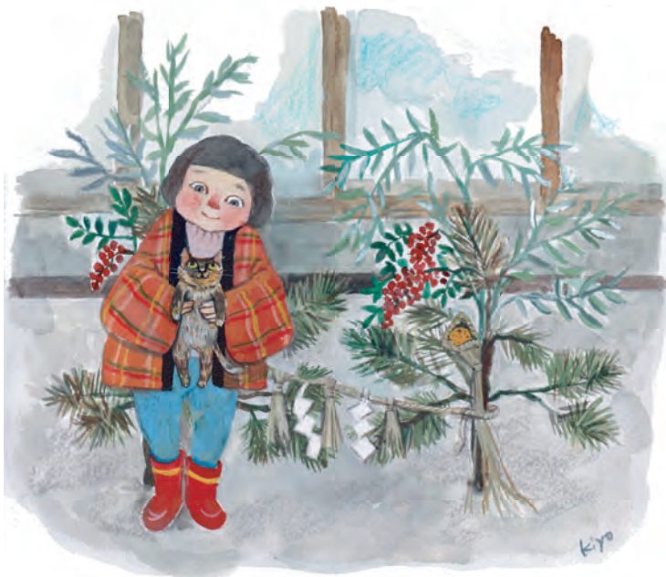
【加子母の風景】加子母の昔ながらの門松はこのスタイルです。

この1年が皆様にとってかけがえのない素敵な1年でありますように。 今年もどうぞよろしく願いたします。