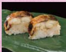
朴葉巻きみそ焼き鯖すし