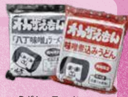
うどん・ラーメン