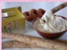
自然薯薯とろろドーナツ