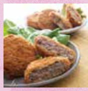
飛騨牛メンチカツ 飛騨牛コロケ