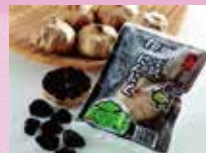
砲山完熟黒にんにく